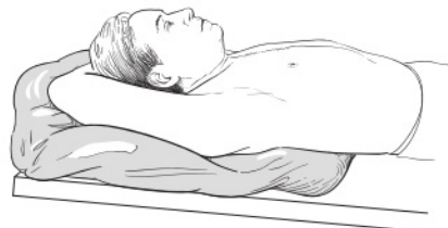
图 1. 在模具中的摆位

在整个模拟治疗过程中，您可能需要一直仰卧。当您躺在治疗床上的时候，将会根据您的上半身制作一个模具。您的放射治疗师会将温热液体倒入一个大塑料袋中，塑料袋将被密封并放置在治疗床上。您将躺在塑料袋上面，仰卧，双臂抬高至头部上方（见图 1）。液体最初会有温度，但会随着变硬而冷却。液体冷却时，您的治疗师将会把该塑料袋贴在您的皮肤上，使其形成您的上半身和手臂的形状。这一过程大约需要耗时 15 分钟。