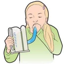
图 3. 使用诱发性肺量计

如果您对帮助孩子在手​​术前后保持活跃有任何疑问，请致电 MSK 复健服务部，电话：212-639-5384。您可以在周一至周五早上 8:00 至下午 6:00 致电联系。