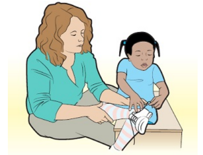
图 1. 与 OT 合作