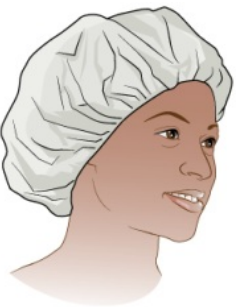
图 5. 一次性发帽