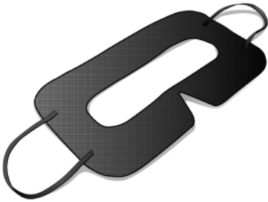
图 4. 一次性眼罩