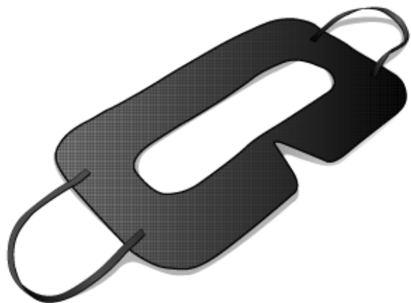
图 4. 一次性眼罩