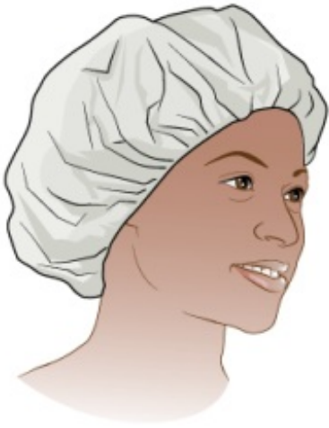
图 5. 一次性发帽