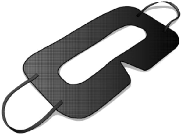
图 4. 一次性眼罩