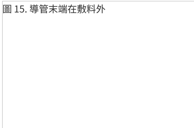
圖 15. 導管末端在敷料外