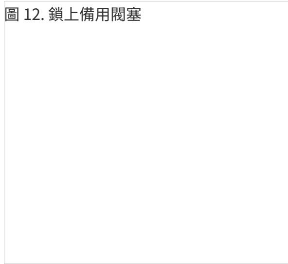
圖 12. 鎖上備用閥塞

如果觸摸了閥塞的內部，請將其丟掉。將導管保持在離開身體的位置。打開另一個引流套件及 PleurX 引流包，並使用新的備用閥塞。