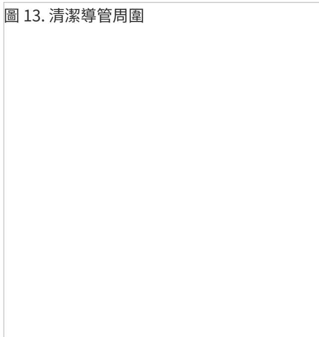
圖 13. 清潔導管周圍