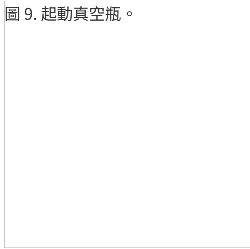
圖 9. 起動真空瓶。