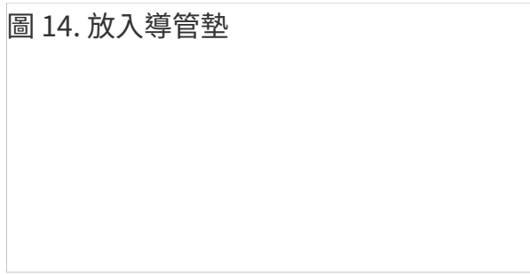
圖 14. 放入導管墊