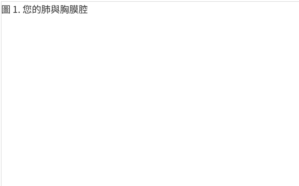
圖 1. 您的肺與胸膜腔

胸膜腔內出現液體是正常現象。這種液體有助於您的肺部在呼吸時平穩運動。有時，在您其中一邊或兩邊肺部的胸膜腔內會積聚過多液體。這使您的肺部難以完全擴張，您可能會感到呼吸困難。