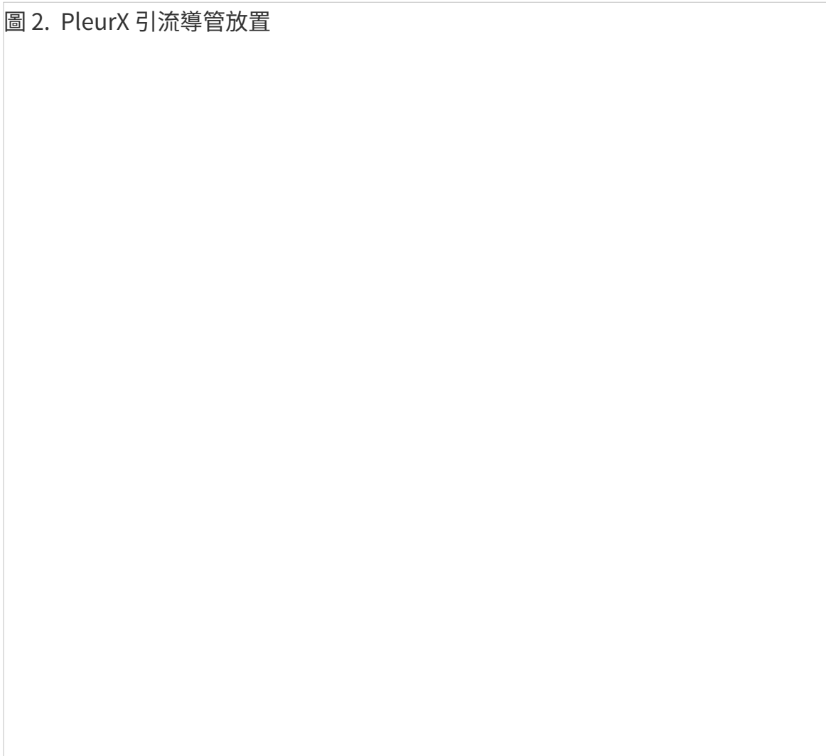
圖 2. PleurX 引流導管放置

當他們做好切口與通道後，醫生會在您的皮膚下插入導管，穿過通道，進入您的胸膜腔（見圖 2）。在皮膚下引導導管會讓您較為舒適，同時也有助於固定導管。