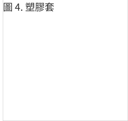
圖 4. 塑膠套