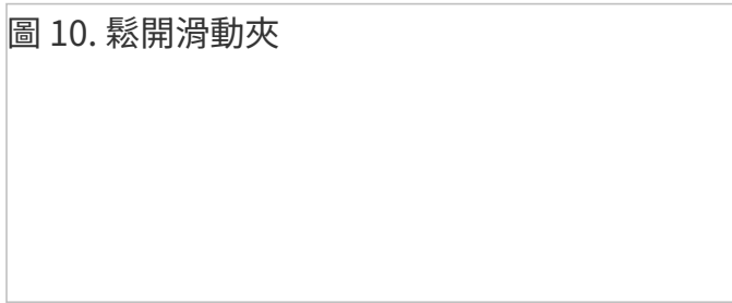
圖 10. 鬆開滑動夾