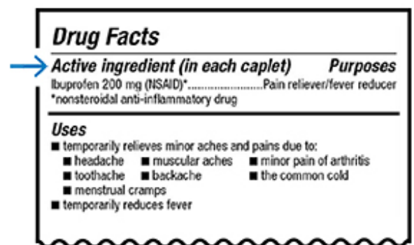
圖 1. 非處方藥標籤上的活性成分