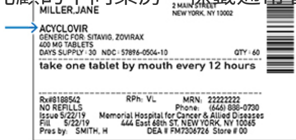
圖 2. 處方藥標籤上的活性成分