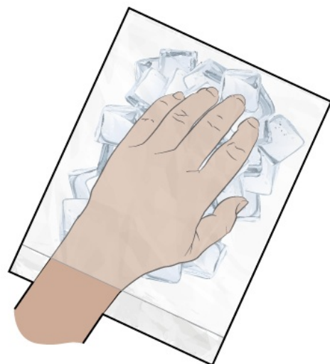
圖 2. 指甲冷卻期間

大部分人使用指甲冷卻不會出現任何問題。有些人可能會感到冰很不舒服和太冷。這樣也會令您在治療期間無法使用雙手和四處移動。有些人會因為這些副作用而停止冷卻。