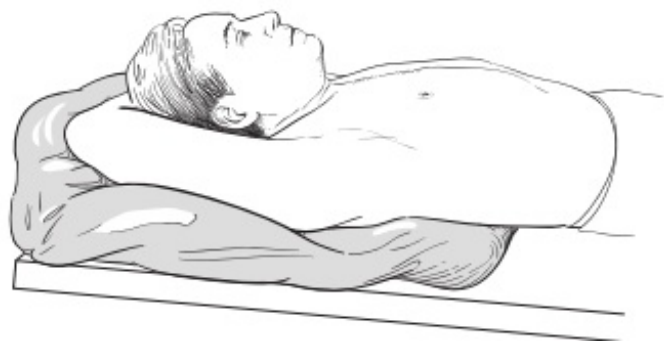
圖 1. 在模具中定位

在整個模擬治療過程期間，您可能需要背部朝下仰臥。您躺在治療床上時，會根據您的上身製作模具。放射治療師會把溫熱的液體倒進大型塑膠袋中，然後把膠袋鎖緊並放到治療床上。您需要背部朝下躺在塑膠袋上方，雙手舉起至高過頭部（請見圖 1）。一開始液體是溫暖的，但會隨著硬化而冷卻。液體冷卻期間，您的治療師會把塑膠袋緊貼到您身上，好讓模具能複製出您上身和手臂的形狀。此程序大約需要 15 分鐘。