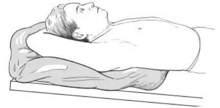
圖 1. 在模具中定位

您以正確位置躺下後，需治療的部位便會接受 X 光掃描。這些掃描可能會以名為「模擬器」的 X 光機進行，也可能會以電腦斷層掃描 (CT) 掃描機進行。如您需進行 CT 掃描，可能會在掃描前透過靜脈注射管線注射顯影劑。這些掃描僅會用來規劃您的治療，不會用於診斷或找尋腫瘤。如您需進行其他成像造影，護士會向您解釋相關事宜。