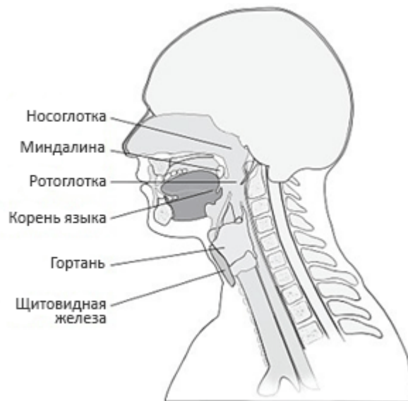
Рисунок 1: Структуры головы и шеи

Ниже приведен рисунок области головы и шеи (см. Рисунок 1). Ваша (ваш) медсестра (медбрат) покажет вам, какая область будет подвержена лечению.