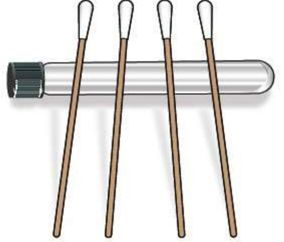
الشكل 1. تجفيف الأعواد على أنبوب الاختبار